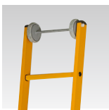
Hjul for oven