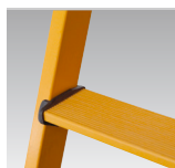
88 mm skridsikre trin