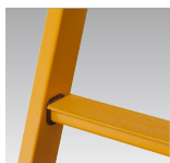
52 mm skridsikre trin