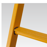
52 mm skridsikre trin